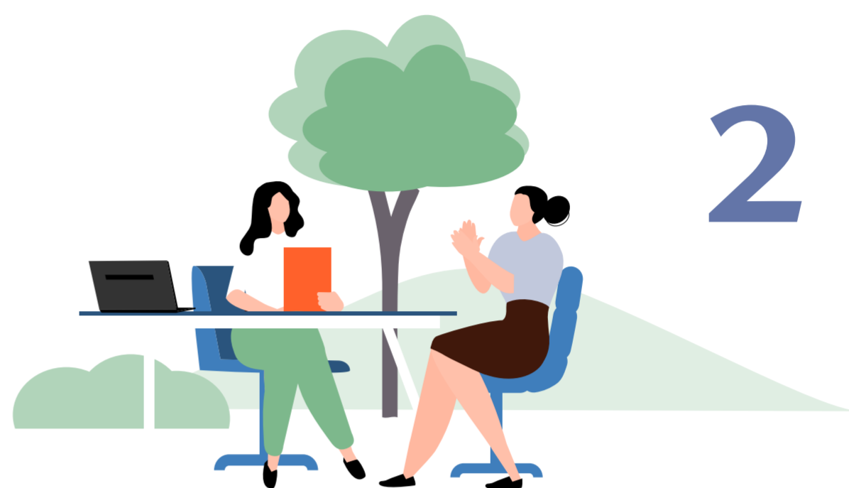
De zorgvraag formuleren