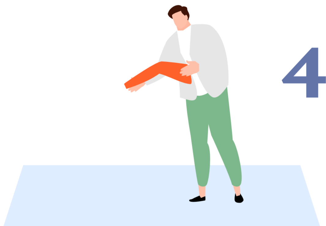
Selecteren, samen beslissen en proberen