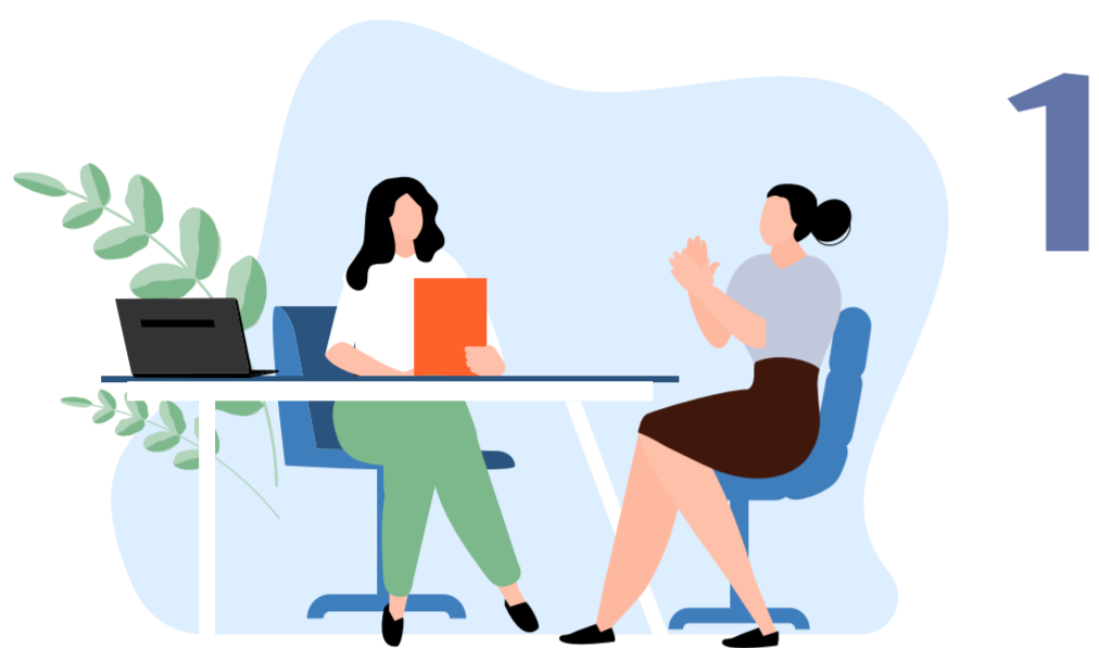
Het probleem signaleren

Uw zorgverlener heeft u verteld dat u voor uw gezondheidsklachten een compressiehulpmiddel nodig heeft. Samen kiest u het meest geschikte middel, via deze stappen.