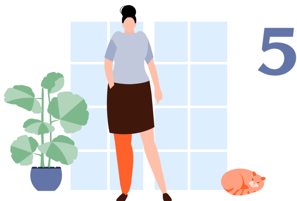
Leveren en instrueren